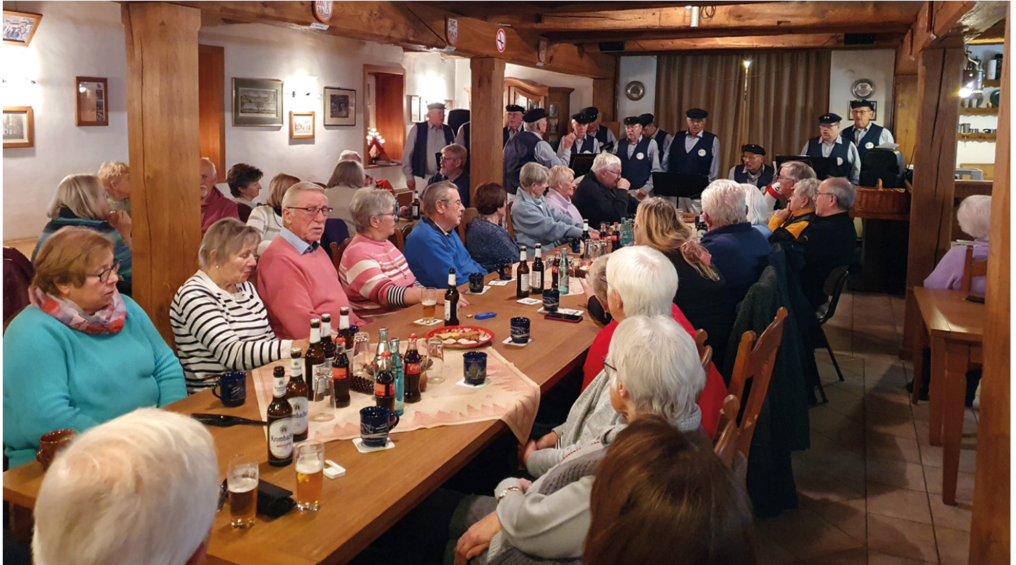
Der Shanty-Chor „Hasejungs“ aus Badbergen trat im Heimathaus Feldmühle des Heimatvereins Bersenbrück mit einem vorweihnachtlichen Konzert auf.

Im ersten Teil der Veranstaltung brachte der Chor Lieder aus dem eigenen Repertoire, also Lieder rund um die Seefahrt. Es folgten dann im zweiten Teil Lieder zur Advents- und Weihnachtszeit, im dritten Teil schließlich wurden gemeinsam Advents- und Weihnachtslieder gesungen. In den Pausen wurden Glühwein und andere Getränke sowie Weihnachtsgebäck angeboten.