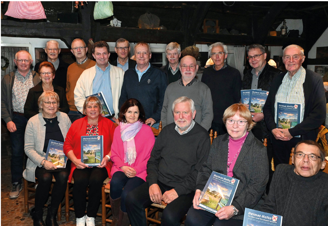
17 Autoren beteiligten sich mit 34 Geschichten am Inhalt des 29. Heimatbests. Unser Foto zeigt sie mit den Ehrengästen bei der Vorstellung.