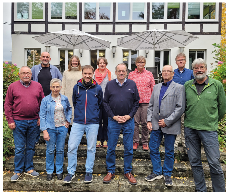
Zur Mitgliederversammlung trafen sich die Vertreter des Landeswanderverbands Nordrhein-Westfalen in Arnsberg.

dem Deutschen Wanderverband e.V., der Europäischen Wandervereinigung e.V., der NRW-Landesregierung und weiteren Institutionen noch besser vertreten zu können, haben die NRW-Wandervereine im Rahmen des 118. Deutschen Wandertags in Detmold den Landeswanderverband Nordrhein-Westfalen e.V. (LWV NRW) gegründet. Zu den Aufgabenschwerpunkten gehören die Koordination der Aus- und Weiterbildung u. a. von Wegemarkierern und Wanderführern über die SGV-Wanderakademie NRW, die Zusammenarbeit im Bereich Natur- und Umweltschutz mit der Landesgemeinschaft Naturschutz und Umwelt NRW (LNU), die Koordination des Ausbaus und der Pflege von Wanderwegen sowie die Zusammenarbeit mit Naturparks und touristischen Akteuren zur Entwicklung des Wandertourismus in NRW.