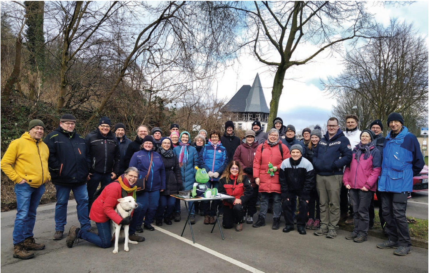
Etwa 20 bis 30 Geocacher waren bei der Eröffnung des Geocaching Powertrails auf dem Arminiusweg dabei.

konnte beginnen. Gemeinsam wurde dann auch schon das erste Versteck in Parkplatznähe gefunden. In den nächsten Tagen und Wochen werden sich viele Schatzsucher auf den Arminiusweg begeben, um ihre Anzahl von gefundenen Geocaches zu erhöhen. Dass ein Cacher bereits mehrere Tausend Caches gefunden hat, ist keine Seltenheit. Die jetzt startende Schatzsuche ist eine sehr schöne Aufwertung für den lange Zeit unbekanntem Arminiusweg.