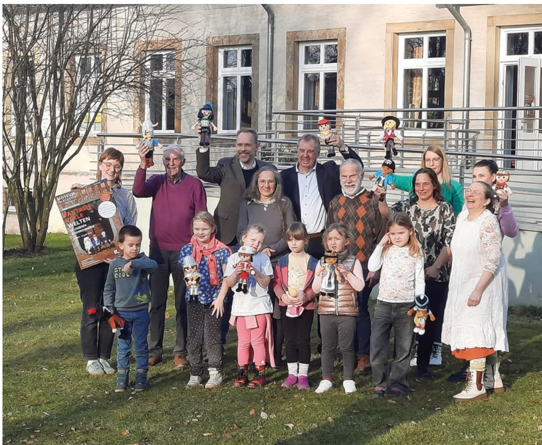
Nach der Eröffnung im Pfarrheim stellte man sich zu einem Erinnerungsfoto auf.

Die Ausstellung „Fantasievolle Welten in unseren Kinderzimmern“ ist bis zum 8. Juni im Museum im Kloster zu sehen. Das Museum hat Donnerstag bis Samstag von 14 bis 17 Uhr und Sonntag von 11 bis 17 Uhr geöffnet. Am 6. April und 18. Mai wird jeweils ab 14 Uhr zu offenen Spielnachmittagen in das Museum eingeladen. Die Ausstellungsmacher bieten jeweils um 14.30 Uhr eine Familienführung an. Dazu gibt es verschiedene Spiel- und Bastelangebote mit Playmobil. Auf Anfrage können in der Ausstellung auch Kindergeburtstage gefeiert oder Führungen gebucht werden. Alle weiteren Infos sind erhältlich unter www.museum-im-kloster.de .